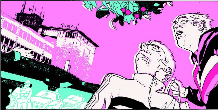
Nürnberg, Bayern: An der Fürther Straße liegt das Quelle-Gebäude. Für die beiden Männer davor sind die Pflaumen am Straßenbaum der Gewinn