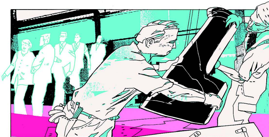
Trappenkamp, Schleswig-Holstein: Merckels Besuch bei der Firma Di.Hako war „eine perfekt inszenierte Theatershow“, sagt der Geschäftsführer

Da mischt sich der Kellner ein. „Greven ist komisch“, sagt er und holt zum Schlag gegen die Poahlbürger – die Pfahlbürger, die Alteingesessenen – aus. „Ohne die geht nichts.“ Andere sagen das auch: Die Frau auf der Kirchentreppe. Der Alte beim Marktbrunnen. Der Mann vor dem Rathaus. „Greven ist seltsam. Und zweite Heimat dazu“, sagt der. Welche die erste? „Griechenland.“ Kann man hier leben? „Wenn man sich nicht einmischt.“ Selbst Teenager, die sich